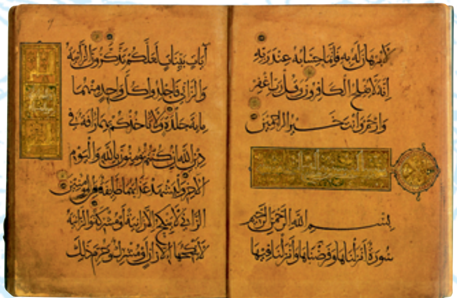
Manuskriptseite aus einer Koran-Handschrift aus dem 11. oder 12. Jahrhundert, München, Bayerische Staatsbibliothek. Geschrieben im persischen Kufi, einem besonderen Stil einer eckigen Schrift, der sich im östlichen Iran unter der Herrschaft der Ghaznawiden und Ghuriden entwickelte. Bei diesem Manuskript sind die Buchstaben in ausgesparte Felder gesetzt, während der Hintergrund mit kleinen Spiralen dekoriert ist.