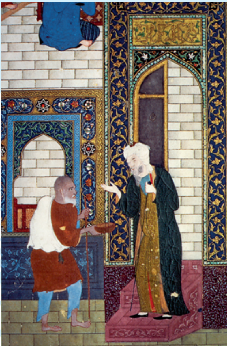
Ein Muslim gibt Almosen: Persische Miniatur aus dem »Bustan« (Garten) von Sa'di, Bihzad aus dem 15. Jahrhundert, Kairo, Nationalbibliothek. Schon zu Lebzeiten des Propheten entwickelte sich aus dem ursprünglich freiwilligen Spenden (»Sadaqa«) die gesetzlich festgelegte Abgabe (»Zakat«) als religiöse Pflicht, die sich dann als eine der fünf Säulen des Islam etablierte.

lungennahmen besteht, sondern sich aus dem dahintersteckenden Wertesystem aktuell ableiten lässt.