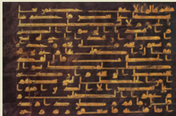
Seite aus dem »blauen« Koranmanuskript aus Ende des 10. Jahrhunderts, Kairuan. Tunis, Nationalbibliothek: Diese berühmte Handschrift, von der sich einzelne Seiten verstreut in vielen verschiedenen Sammlungen befinden, wurde in Ägypten oder in Ifriqiya, dem heutigen Tunis, für die Herrscher der Fatimiden-Dynastie geschrieben.

Wenn man im Zusammenhang mit der arabischen Sprache von Kalligrafie spricht, wird genauer von »Islamischer Kalligrafie« gesprochen. Die Kalligraphie gilt in der islamischen Kultur als die Königin der Künste, als die Kunst schlechthin, deren Erfindung dem Vetter und Schwiegersohn des Propheten Muhammad, Ali ibn Abi Talib, zugeschrieben wird. Warum hat sich in der islamischen Zivilisation diese Form der Schreibkunst so stark ausgeprägt? Oft wird gesagt, dass dies auf das religiöse Bilderverbot zurückzuführen sei. Dennoch gibt es kein allgemeines Bilderverbot im Islam, es ist vielmehr verboten, das göttliche Antlitz darzustellen. Lebewesen abzubilden, wurde allerdings für unvereinbar mit dem unbedingten Bekenntnis zur Einheit Gottes gehalten: Gott allein ist Schöpfer, ein Künstler darf diesen Schöpfungsakt nicht wiederholen. Hinzu kommt noch die